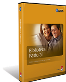
Biblioteca Pastoral Precio de Global University: $174.30

¡Global University recomienda una de estas dos bibliotecas populares!