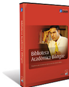
Biblioteca Académica Bilingüe Precio de Global University: $391.30

Vea una lista de los libros en: logos.com/es/productos/detalles/6341